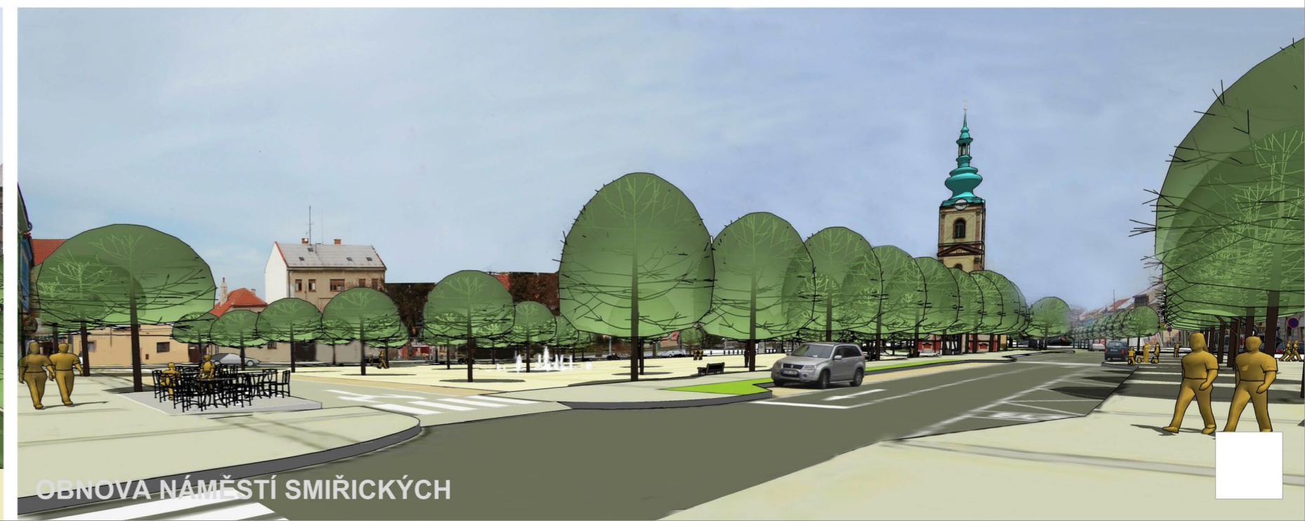
OBNOVA NÁMĚSTÍ SMÍŘICKÝCH